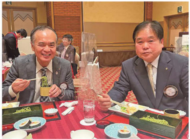
大変美味しい年越しそばを、皆さん笑顔いっぱいいただきました。ご馳走様でした。 年明けも、笑顔で会いましょう。