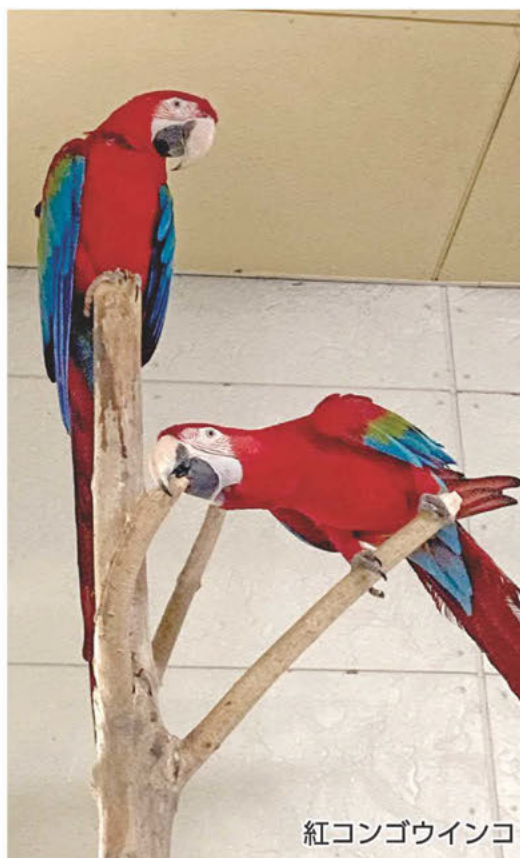
紅コンゴウインコ