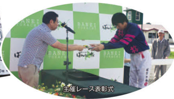
主催レース表彰式