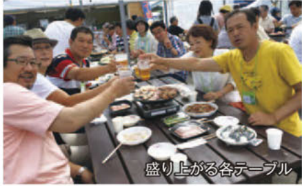
盛り上がる各テーブル