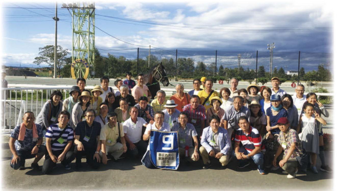
記念レース後の馬場を背景に集合写真