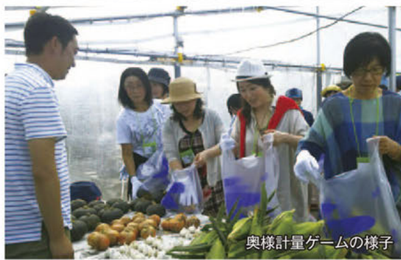
奥様計量ゲームの様子