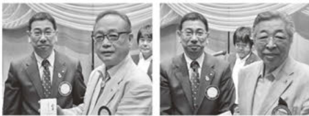
(代表して写真は2名です)