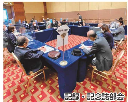
記録・記念誌部会