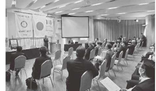
例会終了後次回より実施されるZOOM例会の説明会が行われました

12月の例会が中止になり、1月の例会もZOOM例会になるので、クラブより会員の方々に「おとしだま」として北海道ホテルの食事券が提供されました。皆さん「密」に気を付けて利用しましょう