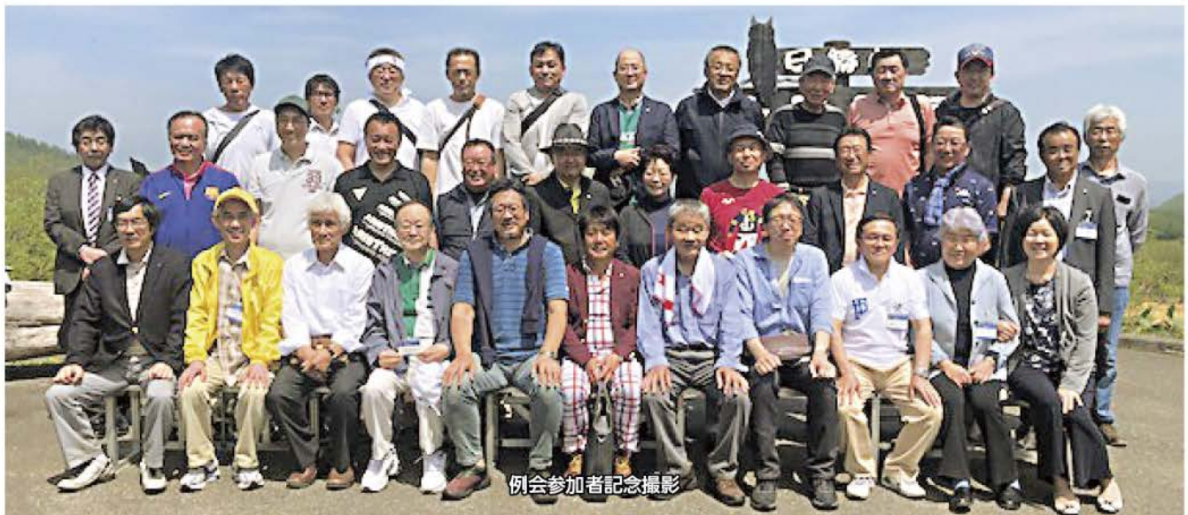
例会参加者記念撮影