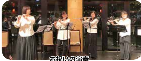
お祝いの演奏 奏者 ノインプレーテ による演奏