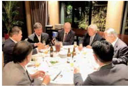
お祝い ゴルフコンペ 表彰