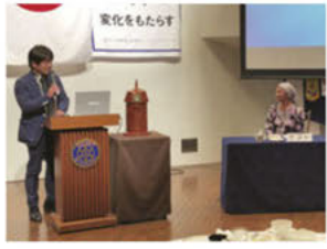
◀小谷副会長より謝辞