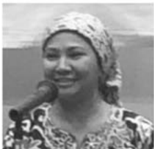
帯広商工会議所 国際ビジネス推進室 シティ アズミラ 様