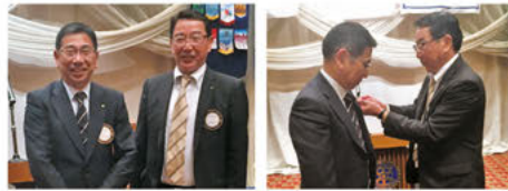
古田会長→石原次年度会長