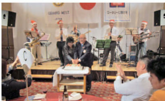
誕生日祝いのケーキ入刀