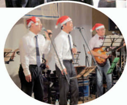
ドクターズバンドの皆様