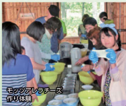
モツアレラチース 作り体験