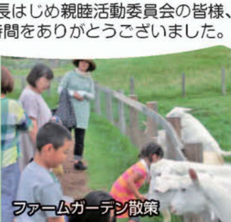
ファームガーデン散策