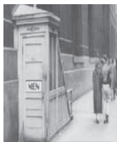
公衆トイレの設置