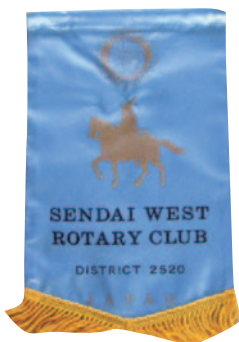
仙台西ロータリークラブ

今後帯広西ロータリークラブの益々の発展と、永遠に日が消える事のないことを願って駄文ですが寄稿いたします。