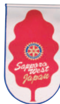
札幌西ロータリークラブ