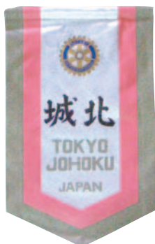
東京城北ロータリークラブ