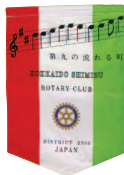
清水ロータリークラブ