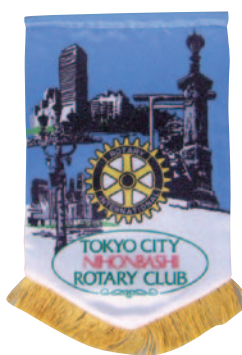
東京シティ日本橋ロータリークラブ