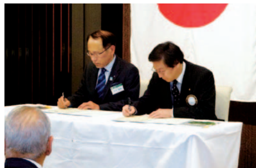
友好クラブ調印式