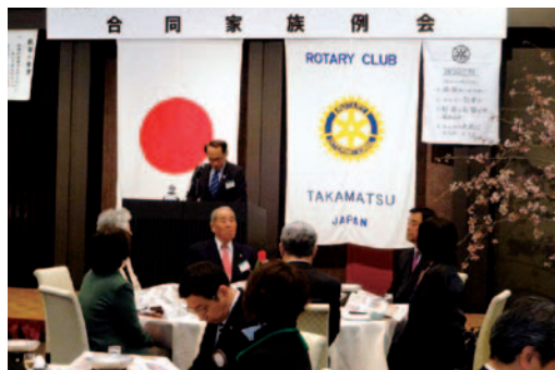
高松RCとの合同家族例会