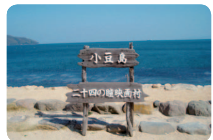
快晴の海をバックに「二十四の瞳映画村」