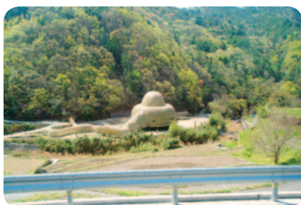
「瀬戸内海国際芸術祭作品」 竹だけで作り上げた家