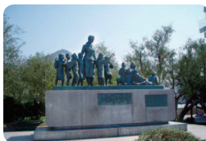
「二十四の瞳像」土庄港