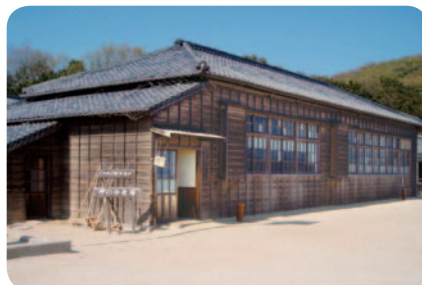
「二十四の瞳映画村 岬の分教場」