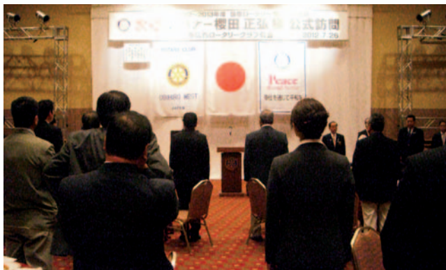
櫻田ガバナー公式訪問例会