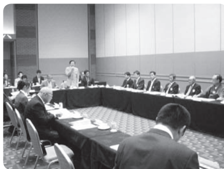
第3回クラブ協議会の模様