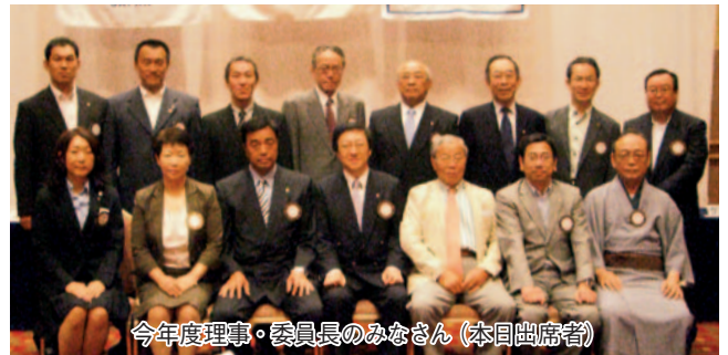
今年度理事・委員長のみなさん(本日出席者)