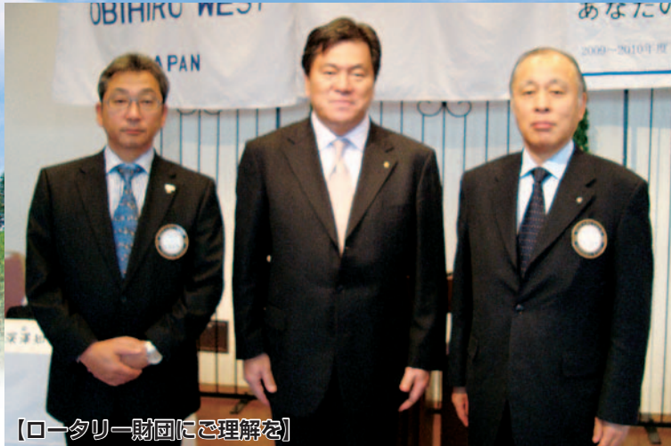
【ロータリー財団にご理解を】