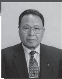
ガバナーエレクト事務所