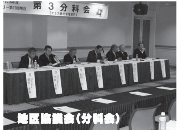
地区協議会(分科会)