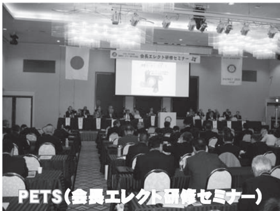
PETS(会長エレクト研修セミナー)