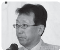
茨木雅敏ガバナー補佐