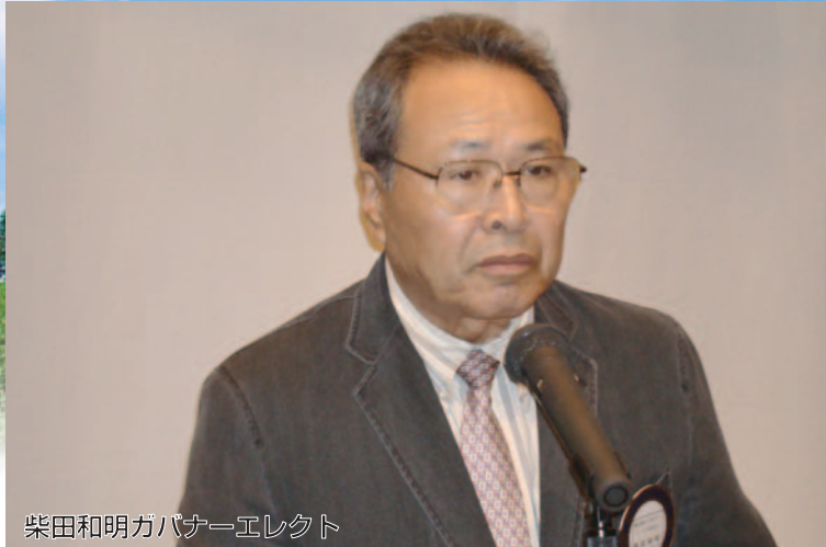
柴田和明ガバナーエレクト